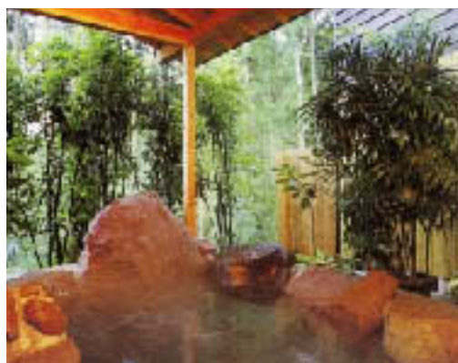
離れ「早蕨」の露天風呂