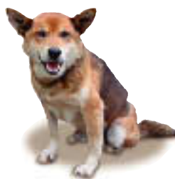
警備員団長 チョロ

離れ10室(露天風呂付客室8室・家族風呂付客室2室)・本館1室 共同浴場(男女別)・お食事処