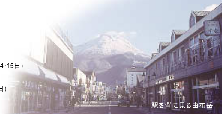
駅を背に見る由布岳