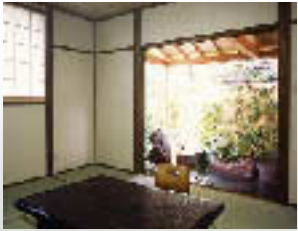
離れ 「早蕨(さわらび)」