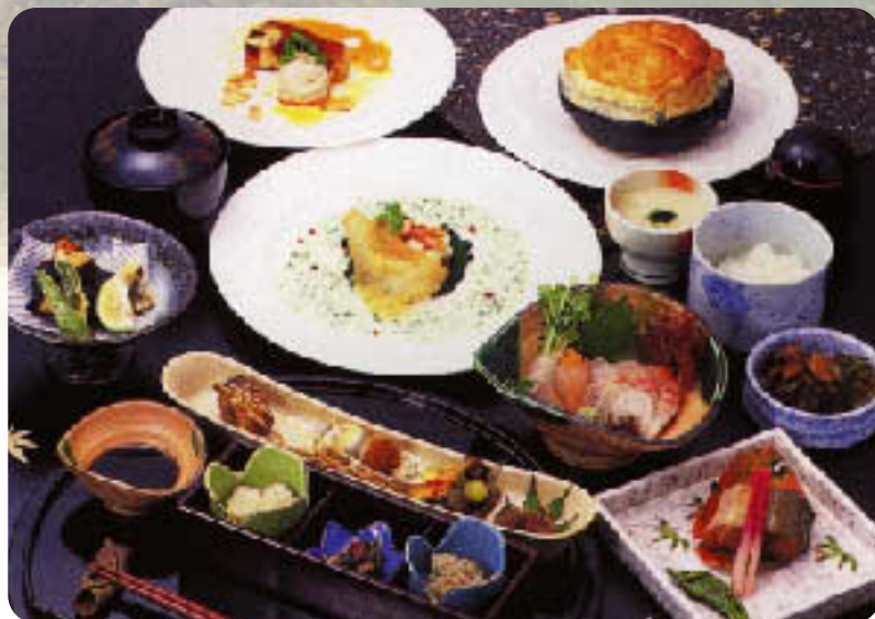
お料理は季節によって変わります